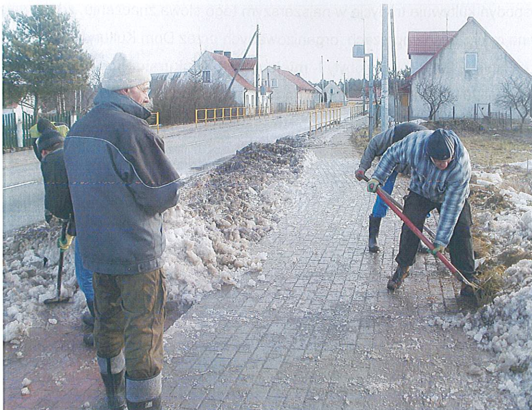
Zimowe odsnieżanie w czynie społecznym na terenie przystanku autobusowego

Koło Gospodyń Wiejskich - kultywuje tradycje i obyczaje naszego regionu, organizuje pokazy i kursy dla kobiet, współuczestniczy w przygotowaniu imprez masowych i okolicznościowych.