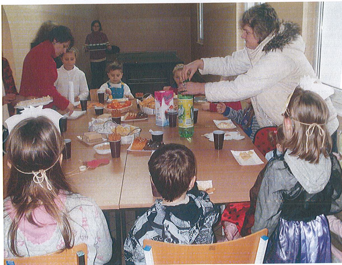
Organizacja imprez dla dzieci