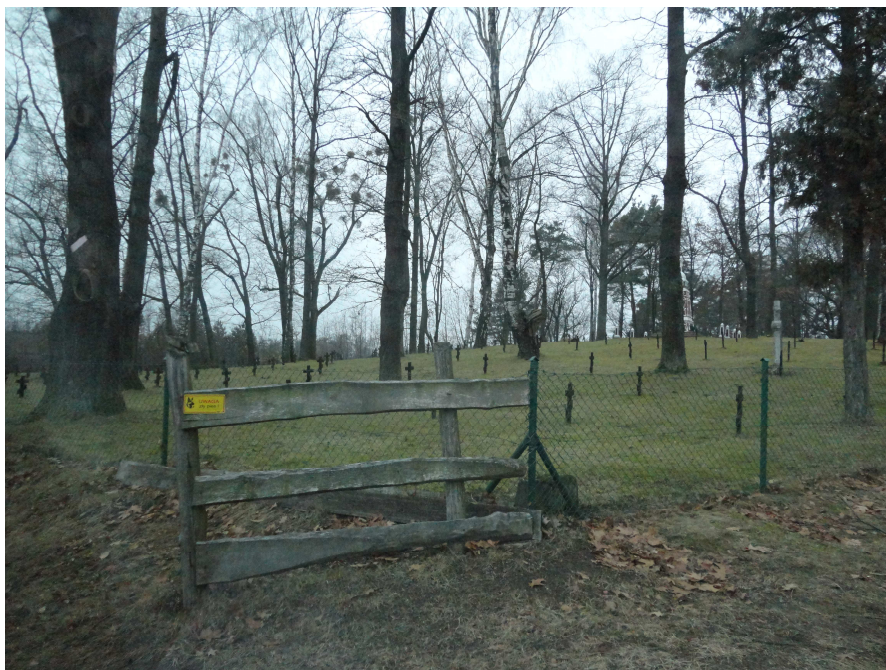
Fot. nr 2. Teren cmentarza na obszarze opracowania.