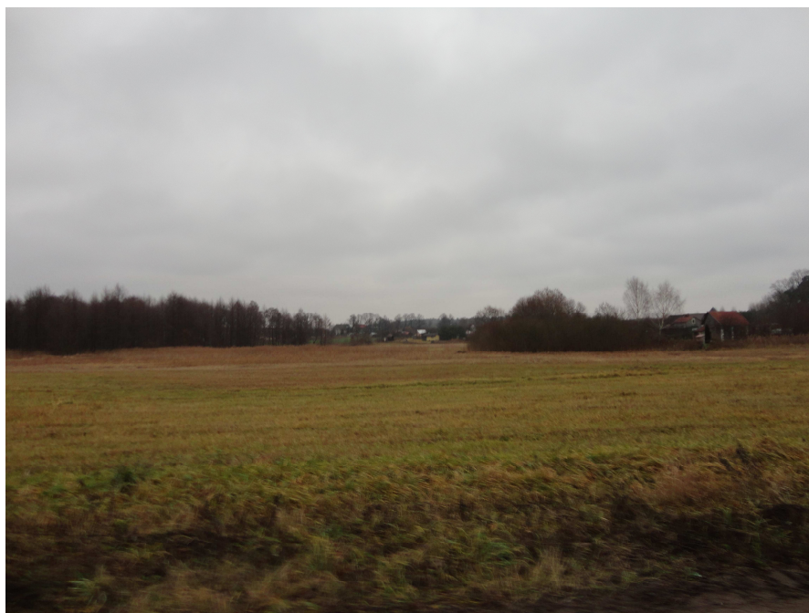
Fot. 3. Fragment terenu nie zabudowanego wraz z drzewostanem wysokim.

Część terenu opracowania jest użytkowana rolniczo, na gruntach ornych są prowadzone uprawy zbóż, na tereny łąk są wykaszane, natomiast pastwiska są ogrodzone i jest prowadzony wypas zwierząt. W czasie wizji lokalnej zaobserwowano krowy mleczne.