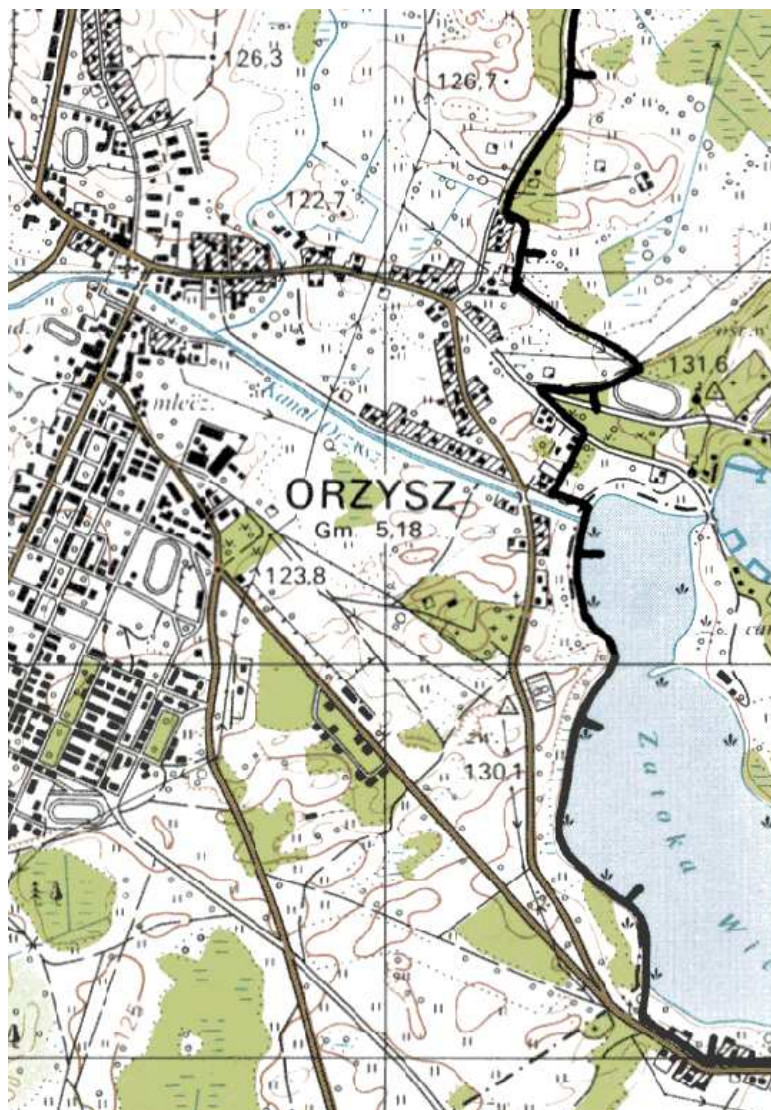
Rys. Wyrys z Ekologicznego Systemu Obszarów Chronionych Województwa Warmińsko – Mazurskiego.

Na opisywanym obszarze nie znajdują się żadne cenne zasoby przyrodnicze. Analizowany teren charakteryzuje się słabymi walorami krajobrazowymi.