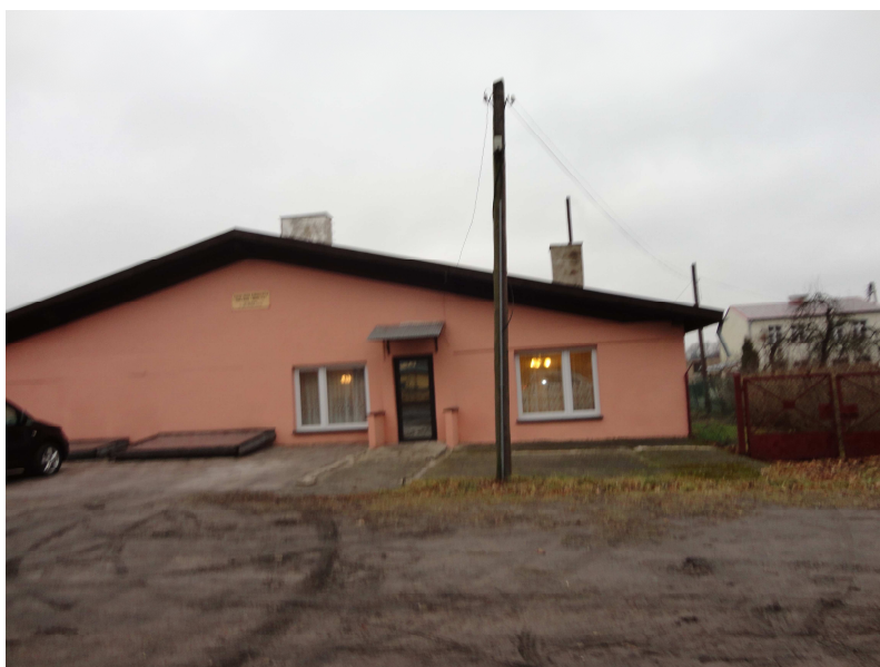
Fot . nr 1. Zabudowa usługowa na terenie opracowania.

Opracowywany teren jest już częściowo zainwestowany, co pokazują poniższe fotografie.