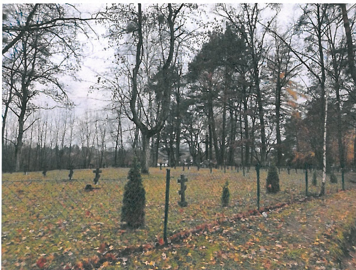
Cmentarz przy ul. Wyzwolenia w Orzyszu