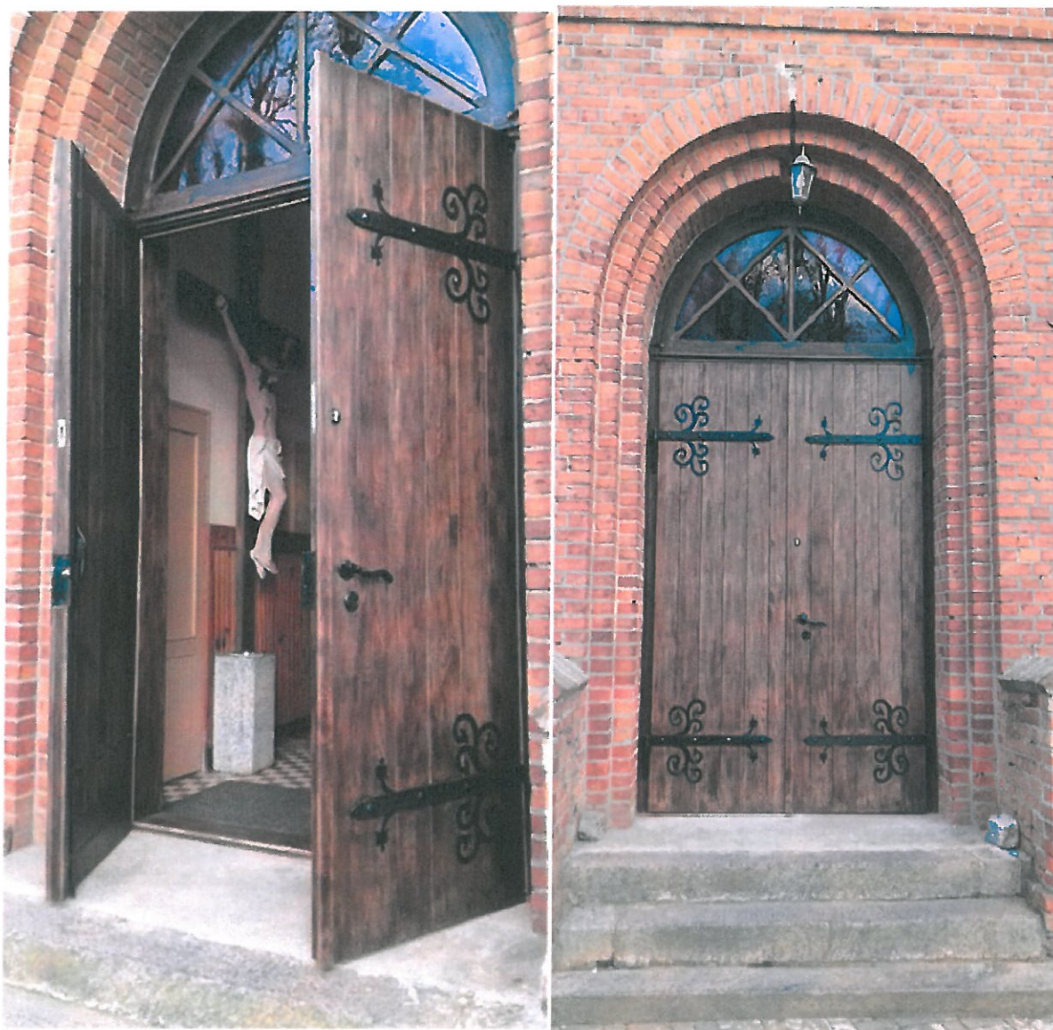
Zdjęcia wykonane w listopadzie 2018 r. – po remoncie

W okresie sprawozdawczym 2018 roku została przyznana dotacja w kwocie 15 000,00 zł z budżetu Gminy Orzysz na prace konserwatorskie przy zabytku – kościół parafialny p.w. Matki Bożej Wspomożenia Wiernych, położonym w Klusach, 12-250 Orzysz, a wpisanym do rejestru zabytków decyzją Wojewódzkiego Konserwatora Zabytków w Olsztynie nr KL.WKZ 534/761/D/89 z dnia 15.12.1989 r. Dotacja została udzielona na dofinansowanie nakładów koniecznych na prace konserwatorskie drzwi wejściowych do kościoła p.w. Matki Bożej Wspomożenia Wiernych w Klusach, gmina Orzysz.