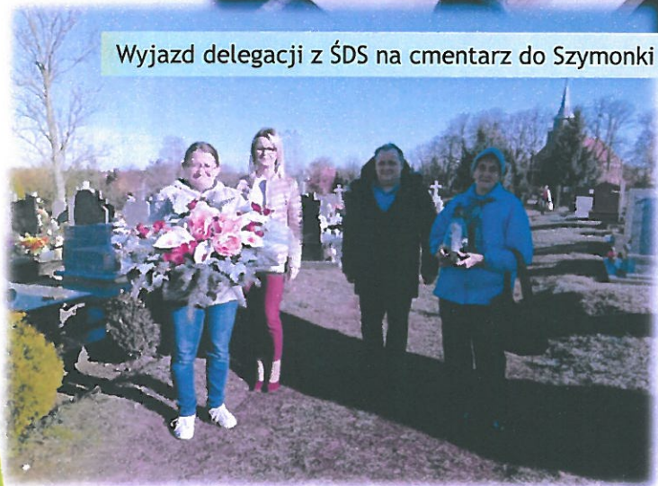
Wyjazd delegacji z ŚDS na cmentarz do Szymonki k. Mikołajek