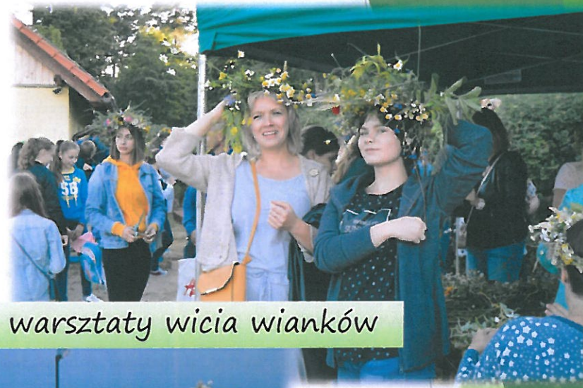
Orzyska Noc Świętojańska – warsztaty wicia wianków