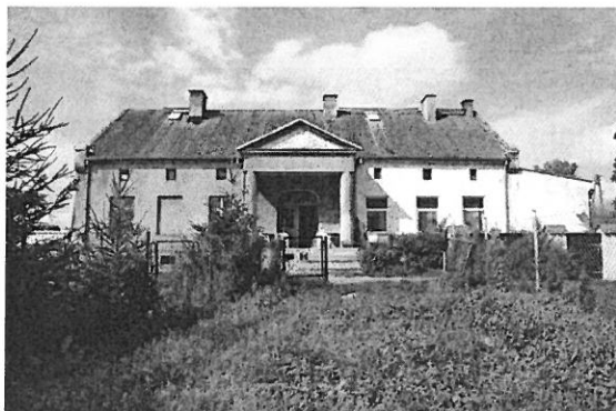
Dwór z przełomu XIX i XX w.

W miejscowości zachował się dawny dwór i niewielkie pozostałości zabudowań gospodarczych. Dwór wzniesiony został na przełomie XIX i XX w. Budowla założona na rzucie prostokąta, parterowa ze ścianką kolankową, przekryta dachem dwuspadowym, od frontu na osi ganek kolumnowy, w polu naczółku pozostałości kartusza herbowego.