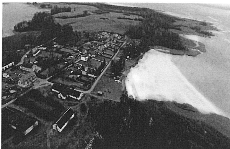
Suchy róg „z lotu ptaka”