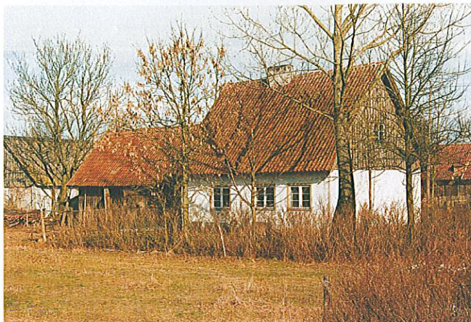
Przykład tradycyjnej zabudowy mazurskiej w miejscowości Gaudynki