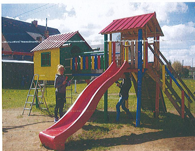
Prace „odświeżające” plac zabaw w Gaudynkach 2015, źródło www.facebook.pl