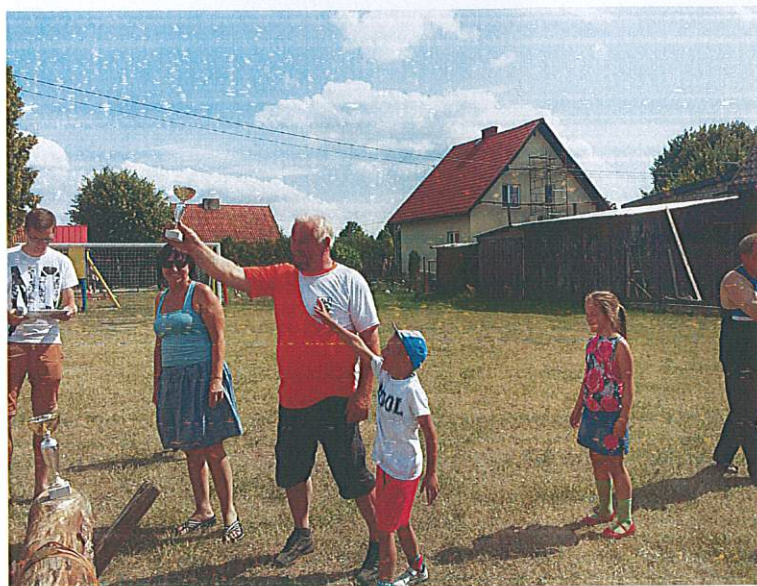
Festyn wiejski w Gaudynkach 2015, źródło www.facebook.pl

oświetlenia wsi i dokończenie drogi lokalnej, której pierwszy etap budowy zakończono 2015 roku.