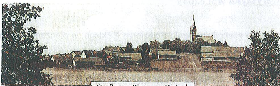
Gruß aus Klaussen, Kr. Lyck