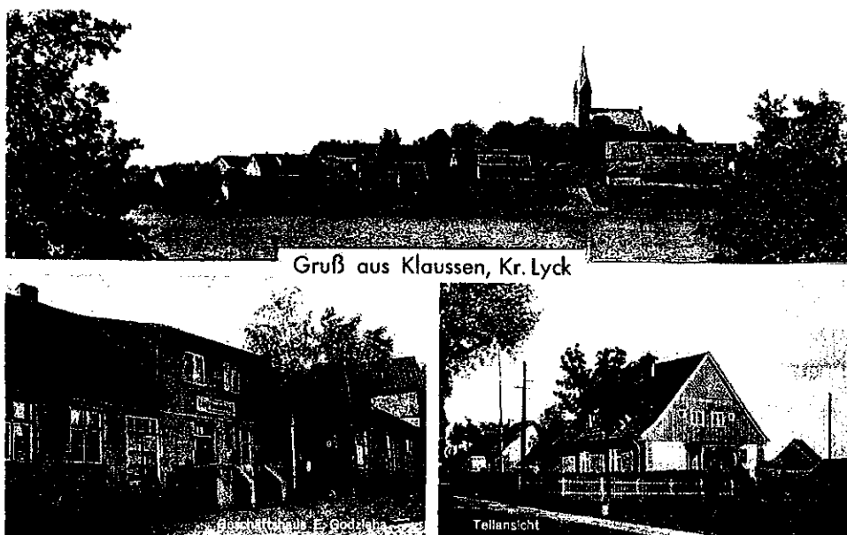
Klasy na starej pocztówce