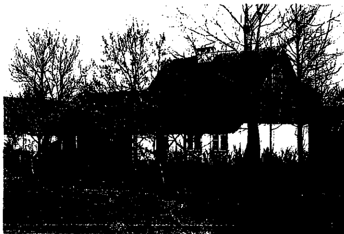
Przykład tradycyjnej zabudowy mazurskiej w miejscowości Gaudynki