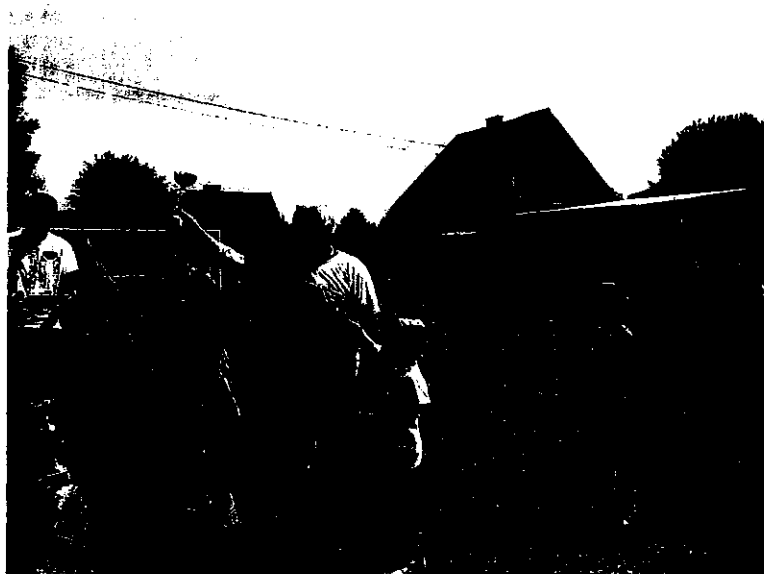
Festyn wiejski w Gaudynkach 2015

oświetlenia wsi i dokończenie drogi lokalnej, której pierwszy etap budowy zakończono 2015 roku.