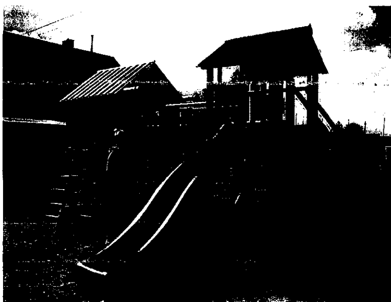
Prace „odświeżające” plac zabaw w Gaudynkach 2015