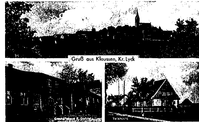
Klusy na starej pocztówce

Miejscowość położona jest w południowo-wschodniej części województwa warmińsko-mazurskiego, około 15 km na wschód od Orzysza, przy DK 16, na trasie Orzysz-Elk. Aktualnie wieś jest siedzibą sołectwa.