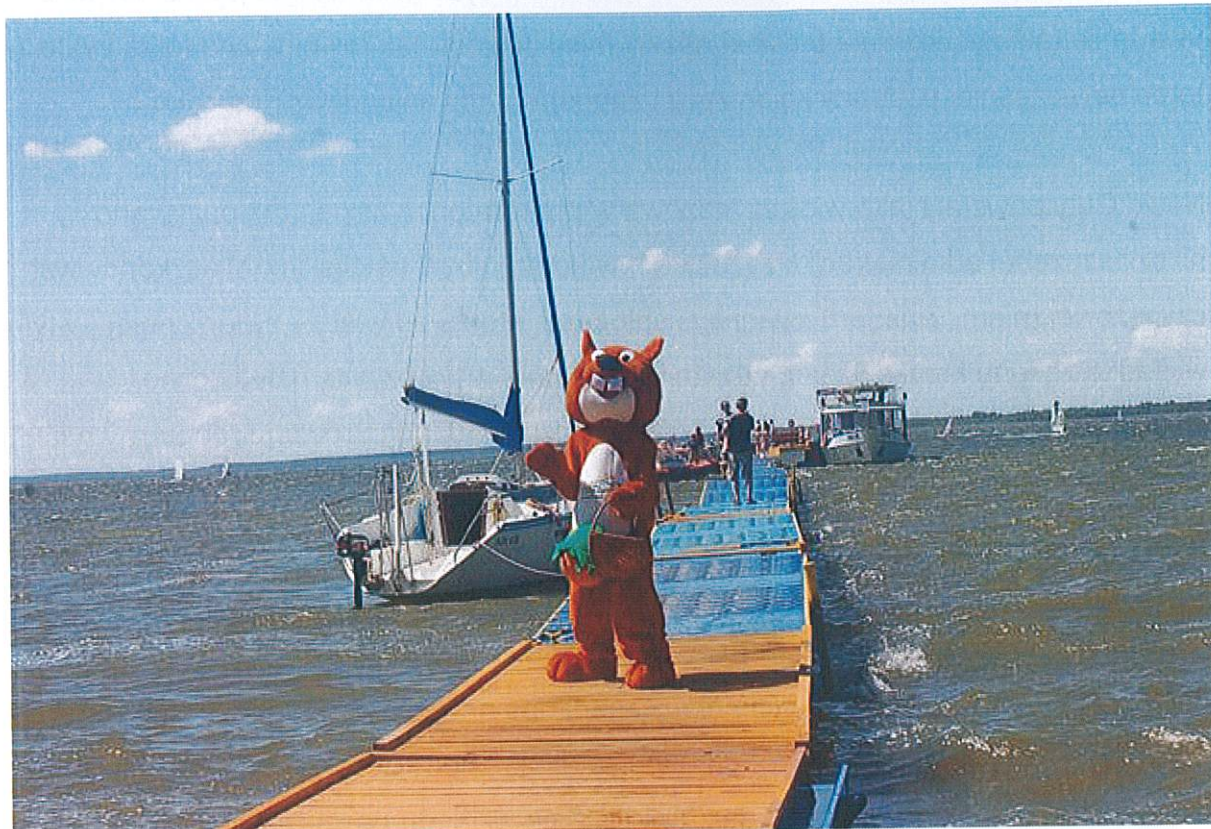
Festiwal - Wiatr woda i Przygoda –Nowe Guty 2010

Warnołyty i Seksty; w części południowej cztery wyspy będące pozostałościami rozmycia moren - największa z nich Szeroki Ostrów. Przez Śniardwy prowadzi trasa Żeglugi Mazurskiej. Jezioro wchodzi w skład Mazurskiego Parku Krajobrazowego. Jezioro niebezpieczne do kajakowania. W jeziorze żeruje węgorz, sandacz, okoń, leszcz, płóć.