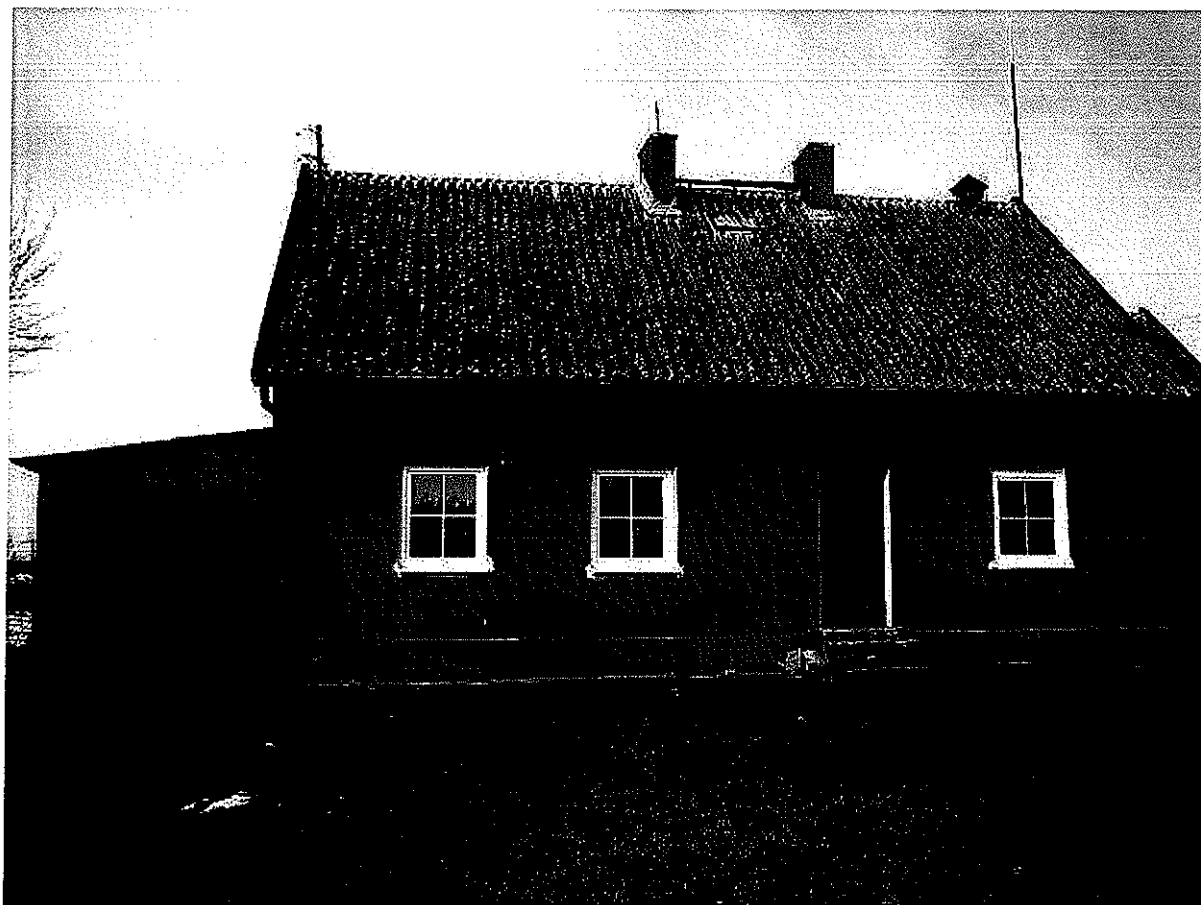
Fot. Budynek świetlicy wiejskiej