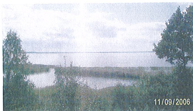
Dziubiele Jezioro Śniardwy