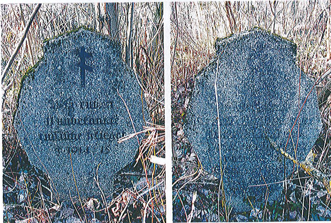
Załącznik do karty: Pianki, cmentarz ewangelicki i wojenny

Podawane w literaturze obiekty archeologiczne w Orzyszu, Piankach i