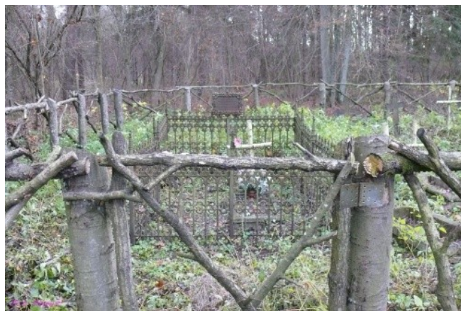
Cmentarz ewangelicki z XIX wieku