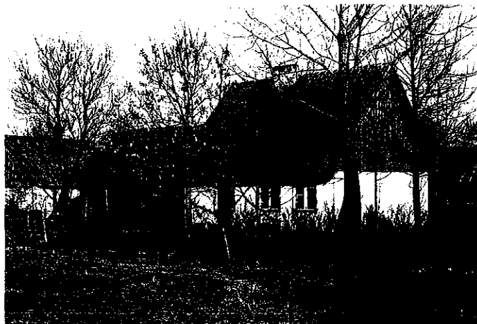
Przykład tradycyjnej zabudowy mazurskiej w miejscowości Gaudynki