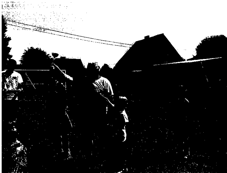
Festyn wiejski w Gaudynkach 2015

oświetlenia wsi i dokończenie drogi lokalnej, której pierwszy etap budowy zakończono 2015 roku.