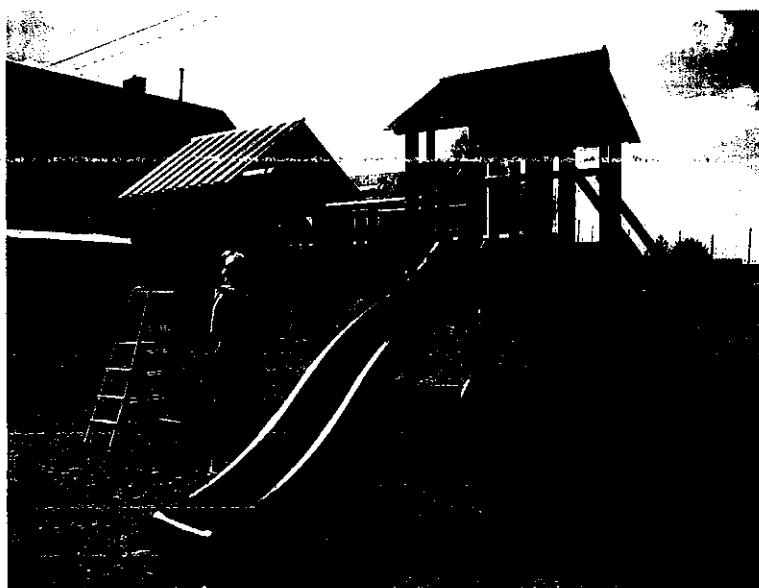
Prace „odświeżające” plac zabaw w Gaudynkach 2015