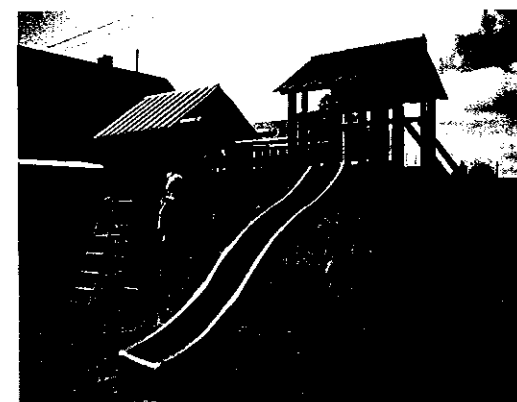
Prace „odświeżające” plac zabaw w Gaudynkach 2015, źródło www.facebook.pl