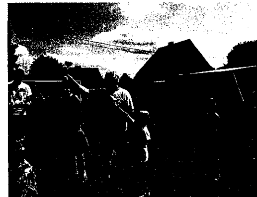
Festyn wiejski w Gaudynkach 2015, źródło www.facebook.pl

oświetlenia wsi i dokończenie drogi lokalnej, której pierwszy etap budowy zakończono 2015 roku.